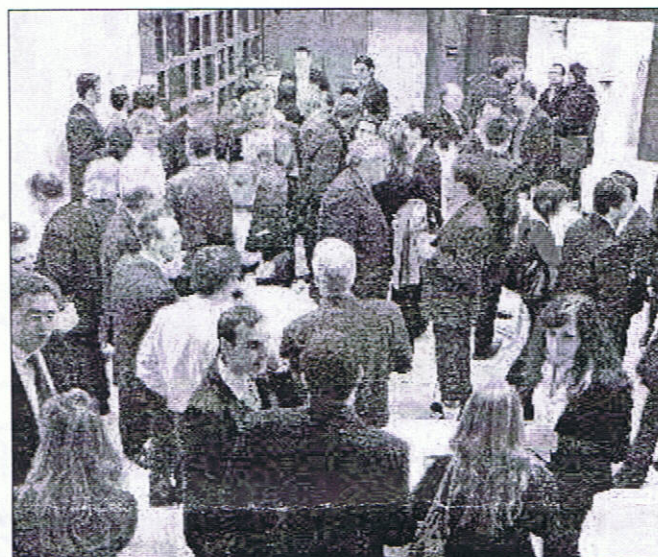
Nakon službenih izlaganja vremena je bilo za razgovore i sklapanje novih kontakata