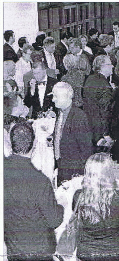
Detalj sa skupa u Frankfurtu